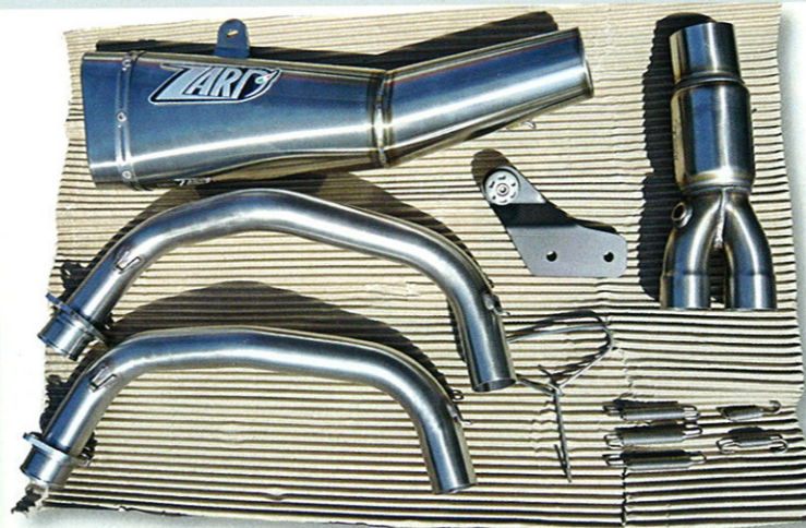
Verarbeitung und Materialgüte der Anlage gefallen auf ganzer Linie