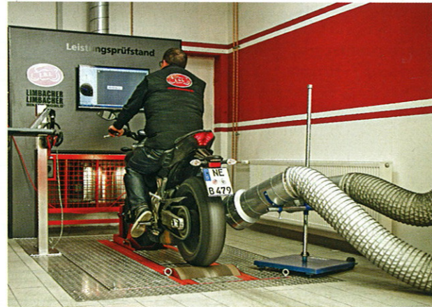
75 PS stehen auf der Einkaufsliste: Die MT-07 liefert großzügig. Ganz oder gar nicht: einteilige Auspuffanlage

EG-Zulassung unter www.zard.auspuff.de bezogen werden. Geringfügig günstiger kommt man im bekannten Online-Auktionshaus weg. Der Anbau ist naturgemäß etwas aufwändiger als beim Slip on-Pendant, erklärt sich jedoch von selbst und sollte auch vom Schrauber-Laien