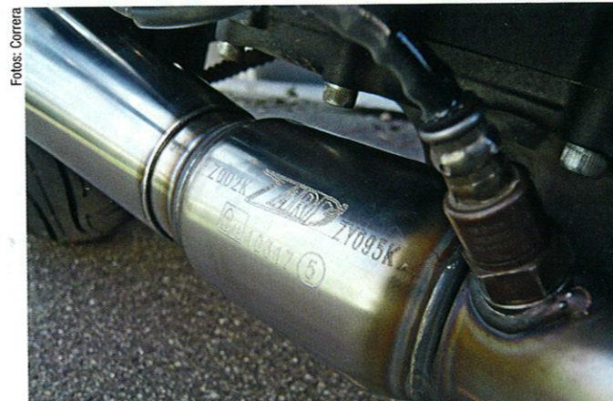
Kat, E-Zeichen und Lambdaanschluss machen das Sounderlebnis legal

in zwei Stunden gut zu bewerkstelligen sein. Jedoch wird keine Montageanleitung mitgeliefert, der deutsche Importeur BOS arbeitet aber bereits daran und hilft derweil gerne bei Problemen. Pure Rauschbeschleunigung beim Anlassen: Die laute und dreckige Mischung aus Knattern und Bollern erschreckt beinahe. Beim Fahren, Drehen, Schalten dann eine wahre Soundorgie. Man wähnt sich akustisch auf 100 PS, mindestens. Schon im gesetzkonformen Trimm halb stark trötend laut, brechen alle akustischen Dämme, sobald man die Dezibel-Eater entfernt: „Brutaler Twin-Donner“ trifft es wohl am besten. Man verliert im relevanten Bereich bis 7000/min zirka ein PS und gewinnt im weniger relevanten Bereich ab 7000/min dasselbe. Drehmoment analog. Sei es drum, diese akademischen Werte sind nicht spür- und angesichts der Wucht des Sound-Furiosos vernachlässigbar. Das Suchtpotenzial der MT-07 wird mit der Zard also klar gesteigert. Gar nicht so harmlos, diese Einstiegsdrogen. René Correra