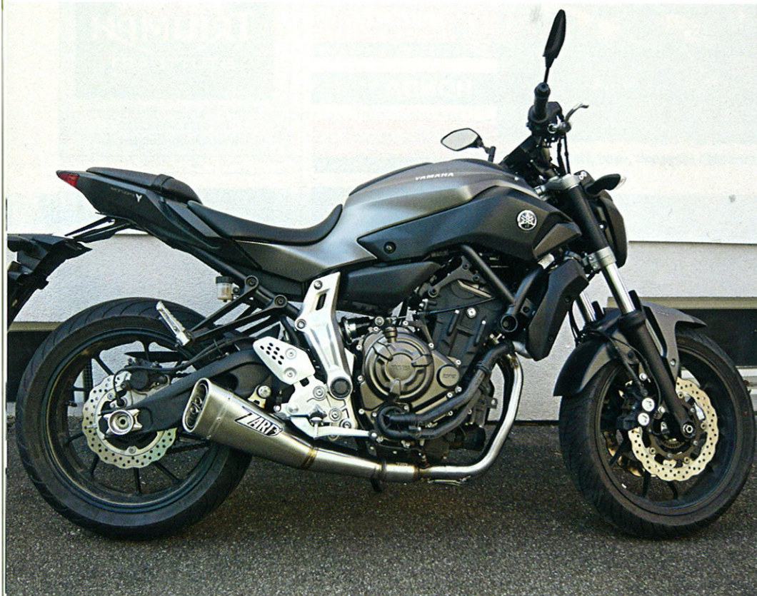
Zard „Short“ für 699 Euro. Carbon-Endkappe (49 Euro) und schwarze Beschichtung (219 Euro) als Extra